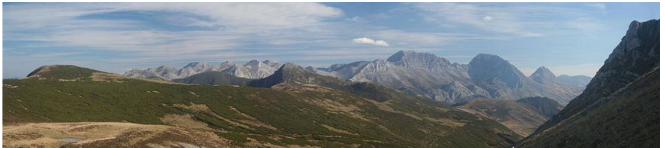
Ilustración. El Puerto de La Mesa a la izquierda, el macizo de las Ubiñas desde la vertiente de Babia a la derecha y en medio el Camino Real del Puerto de la Mesa

La calzada se adentra en Asturias proveniente de la antigua Asturica Augusta , hoy Astorga, por el concejo de Belmonte de Miranda y Somiedo. La senda recorre los municipios de Belmonte de Miranda, Candamo, Grado, Las Regueras, Proaza, Quirós, Santo Adriano, Somiedo, Teverga y Yernes y Tameza. En estos municipios recorre los espacios protegidos del Parque Natural de Somiedo, el Parque Natural de Peña Ubiña, La Mesa, y el Paisaje Protegido del Pico Caldoveiro.