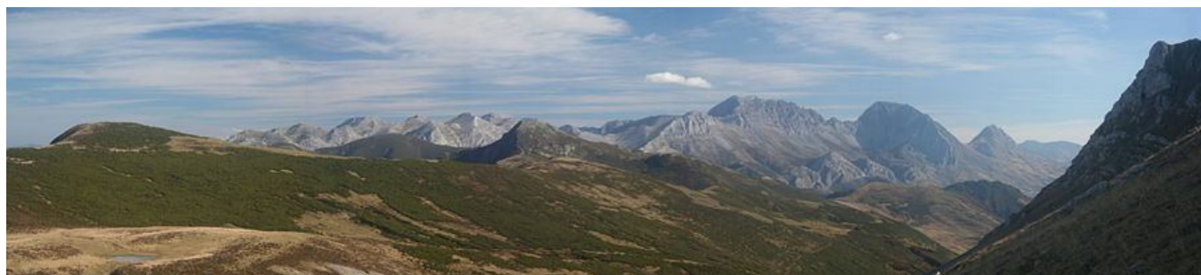
Ilustración. El Puerto de La Mesa a la izquierda, el macizo de las Ubiñas desde la vertiente de Babia a la derecha y en medio el Camino Real del Puerto de la Mesa

La calzada se adentra en Asturias proveniente de la antigua Asturica Augusta , hoy Astorga, por el concejo de Belmonte de Miranda y Somiedo. La senda recorre los municipios de Belmonte de Miranda, Candamo, Grado, Las Regueras, Proaza, Quirós, Santo Adriano, Somiedo, Teverga y Yernes y Tameza. En estos municipios recorre los espacios protegidos del Parque Natural de Somiedo, el Parque Natural de Peña Ubiña, La Mesa, y el Paisaje Protegido del Pico Caldoveiro.